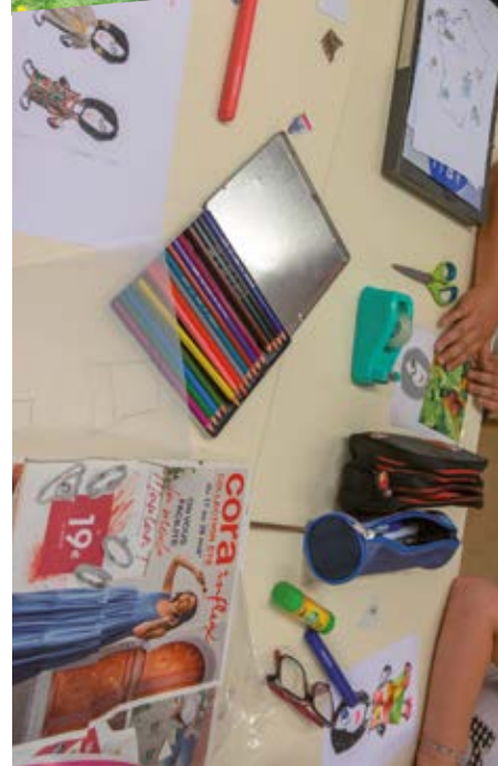
La maison qui m'accueille : écoutons les enfants

FÉDÉRATION DE L'ENTRAIDE PROTESTANTE GRAND-EST 6 rue Sainte-Élisabeth CS 20012 67085 Strasbourg grandest@fep.asso.fr 06 27 11 83 10