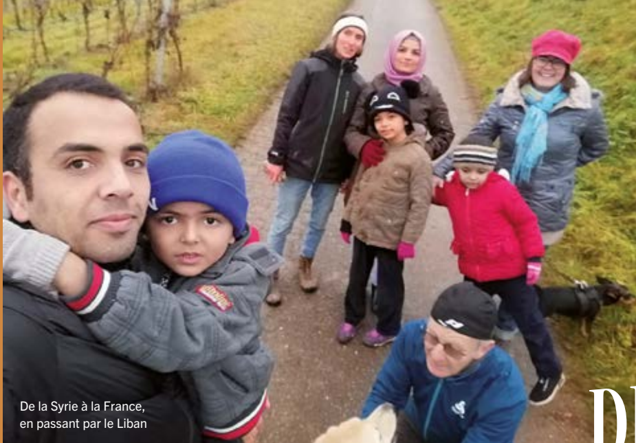
De la Syrie à la France, en passant par le Liban