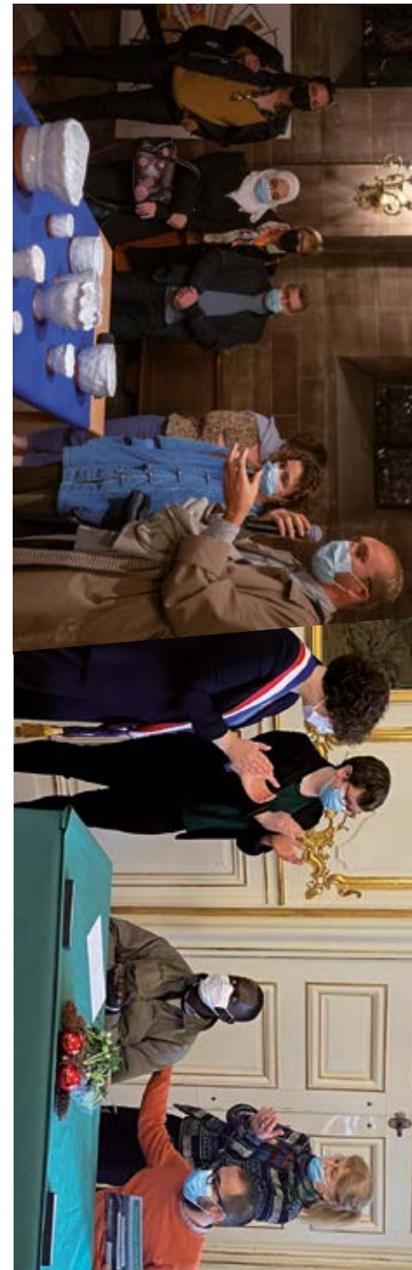
La cérémonie de parrainage citoyen à la Mairie de Strasbourg.

Chaque année, à l'occasion de la journée mondiale des réfugiés, la Ville de Strasbourg et l'association Foyer Notre-Dame organisent une semaine d'activités, conférences et animations pour déconstruire les préjugés autour de la migration et sensibiliser le grand public au débat migratoire. L'évènement réunit 40 partenaires, plus de 1500 participants, et 45 actions ont été proposées. La FEP Grand Est a proposé une table ronde sur la communication interculturelle ainsi qu'une conférence intitulée « Comment accueillir des réfugiés en tant que citoyens sans s'épuiser ? » avec la sociologue Évangeline Masson-Diez au Lieu d'Europe à Strasbourg. Une vingtaine de participants curieux et enthousiastes étaient présents à chacun de ces évènements.