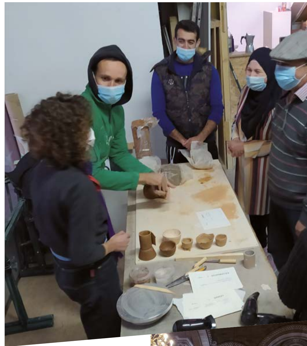
Design : Supervision-design.fr — Jacqueline Trichard, Leila Fromager, Cécile Clément

DANS LES INSTANCES DE : ABRAPA, CCAS de Strasbourg, Faculté de Théologie Protestante – Université de Strasbourg, Fédération Nationale des Institutions de Santé et d'Action Sociale d'Inspiration Chrétienne (FNISASIC), Fondation Arc-en-Ciel, Fondation Le Refuge, URIOPSS Grand Est, VISA Année Diaconale.