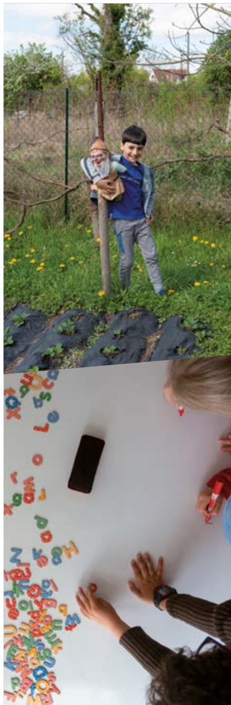
La maison qui m'accueille : des enfants nous parlent